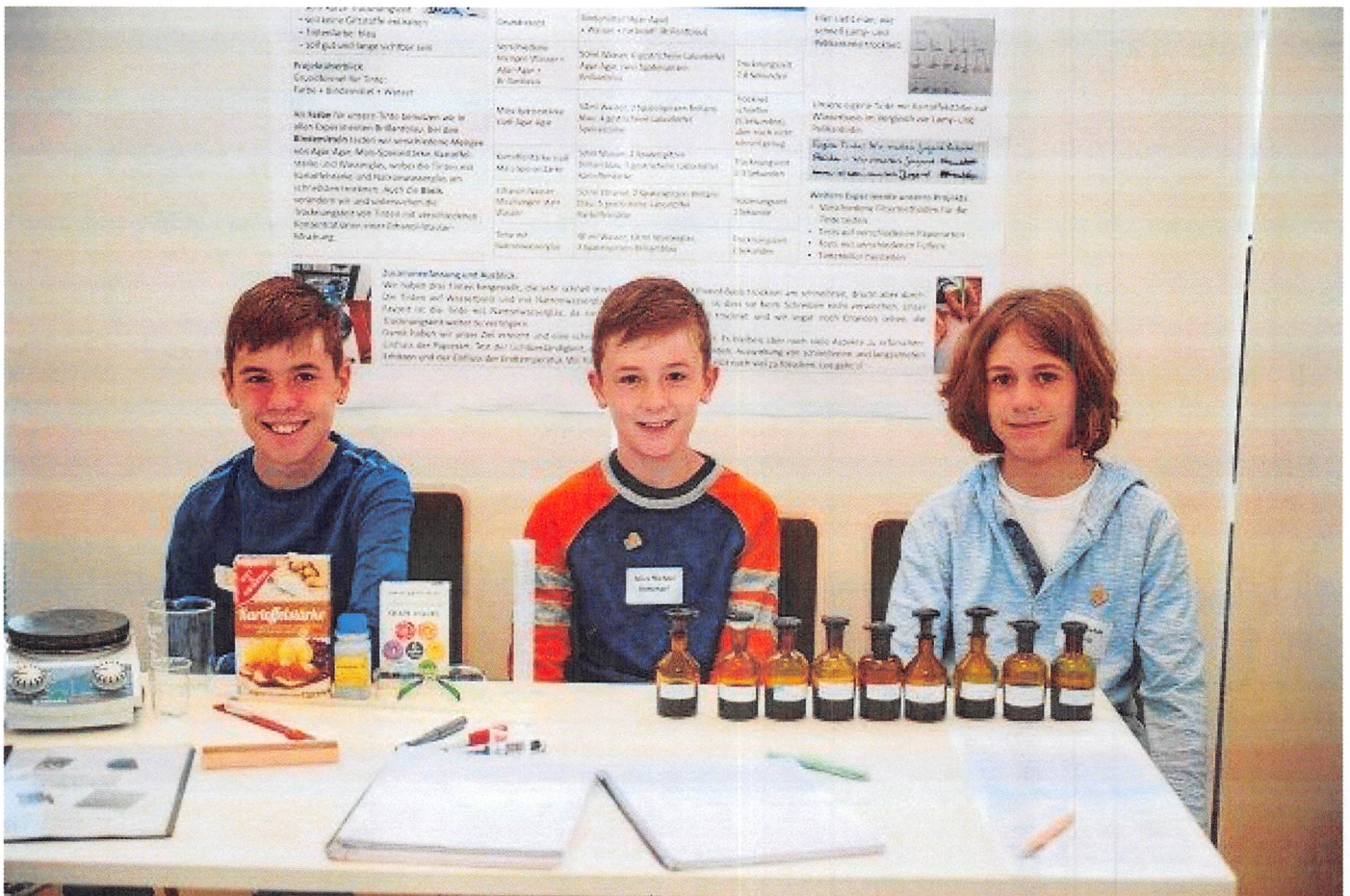
Beim Landeswettbewerb konnten die Kant-Schüler überzeugen.